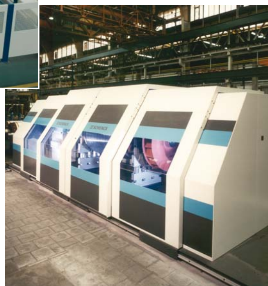
Proteção classe C

A cobertura de proteção deve ser capaz de conter qualquer tipo de fragmento projetado pelo rotor.