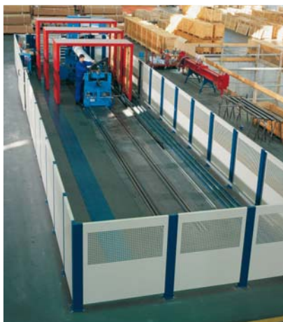
Proteção classe B

A cobertura de proteção deve ser capaz de conter qualquer tipo de fragmento projetado pelo rotor.