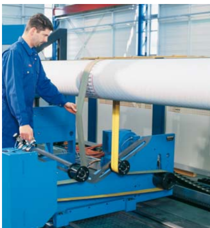
Acionamento por correia (BU)

A seleção do sistema de acionamento é determinada pelo formato de seus rotores. A combinação de diferentes tipos de acionamento em uma máquina é possível. Os acionamentos por correia (BU) permitem uma