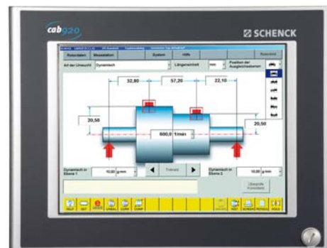
Unidade de medição CAB 920

A calibração permanente significa que apenas com a inserção de poucos dados geométricos, a unidade de medição encontra-se ajustada para balancear um tipo novo do rotor. Características como o armazenamento de valores medidos, auxílio posicionamento angular e exibição das instruções ajudam o operador a executar um balanceamento rápido e eficiente. O CAB 920 oferece ainda funcionalidade e ergonomia superior. Uma variedade de módulos específicos de software está disponível para ambas as unidades de medição.