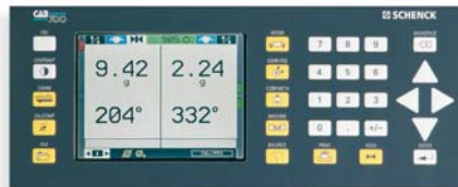
Unidade de medição CAB 700

A proteção classe B deve ser escolhida quando o contato com o rotor ou partes do sistema de acionamento podem resultar em acidentes. A classe C é utilizada nos casos onde o perigo da projeção de fragmentos destacados do rotor não pode ser totalmente controlado. O tamanho, formato, dureza e velocidade tangencial de um fragmento projetado são utilizados para calcular o potencial de penetração