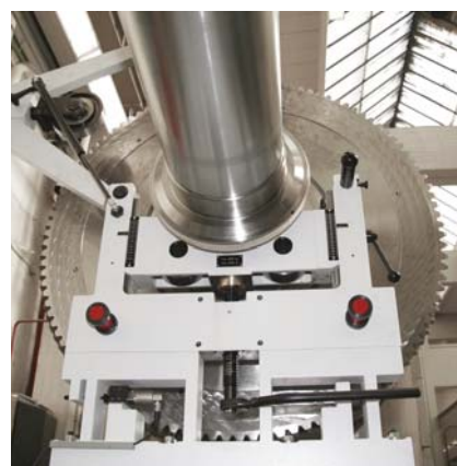
Pedestal HM: robustos e compactos, com alta rigidez, elevada linearidade e baixo amortecimento. Utilização do princípio subcrítico Schenck, com a seção intermediária do pedestal projetada como um dinamômetro de alta resistência. Os captadores são montados fora da área de atuação das forças e, assim, insensíveis a impactos.